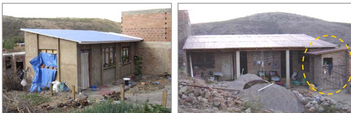
Figura 02: Tipología de vivienda - tipo medias aguas - un ambiente múltiple y baño

VIVIENDA - Casa concluida , complementada con la frase para tener un mínimo de confort ; es una manifestación expresa por las necesidades y deseos de los pobladores de tener acceso a una casa terminada. Probablemente porque actualmente el 90% de las edificaciones se encuentran en obra gruesa, o sea a medio construir; así retomando el discurso de un poblador al respecto manifiesta que: “La casa terminada y con muebles es comfortable” . (M - C). Por otro lado existen moradores con viviendas simplificadas a un ambiente de uso múltiple adjunto a un baño provisional tipo medias aguas, estas viviendas no ofrecen confort para los moradores, por sus espacios reducidos y superposición de actividades.