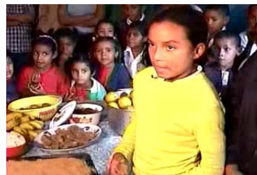
Niña hablando de la dulcería criolla de su localidad

Esta fase responde al proceso de fortalecimiento de la identidad nacional, regional y local. En el marco de una aproximación psicosocial que se sirve para el término del proceso investigativo de la IAP como enfoque metodológico, la presentación de la Historia Local en la comunidad no solamente remite a una devolución de los datos, sino que es concebida como una actividad de integración entre la labor del Activador(a) y la Comunidad.