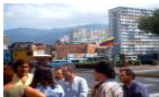
Comité de Tierra Urbano de la Parroquia “23 de Enero”, Caracas

Ahora bien, la Historia Local o Historia Matria es aquella que nos remite al pasado de las localidades, sean parroquias, barrios o urbanizaciones, ofreciéndonos un panorama de las motivaciones, individuales y colectivas, de un gran valor para el conocimiento, cultivo y uso de la población en general. Un rasgo característico de este tipo de historia es que se sirve de fuentes de tipo oral y, particularmente, provenientes de las comunidades, lo cual le confiere un contenido afectivo de gran valor por ser, precisamente, la experiencia subjetiva de sus habitantes. La importancia de la Historia Local reside en el hecho de ser fuente de “ diagnóstico ” de sucesos muy especiales para las comunidades que se traducen en un cúmulo de conocimiento afectivo capaz de fortalecer la identidad de la comunidad, la integración de sus miembros y las acciones tendientes al desarrollo de su entorno inmediato. Sobre esto último, algunos ejemplos son: las Cartas de Barrios y las Mesas Técnicas de Agua que se están realizando por todo el territorio nacional.