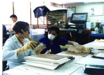
La Historia Escrita en la División de Conservación del IABNSB

la premisa de la flexibilidad o susceptibilidad al cambio.