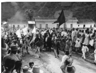
Celebración de San Miguel Arcángel en Burbusay, Edo. Trujillo