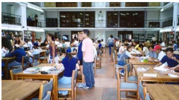
Sala de lectura de la Biblioteca Pública Central "Simón Rodríguez", Caracas

Los Archivos: son producto de la actividad de las instituciones que han conformado la organización jurídica-administrativa del país desde la época colonial hasta nuestros días.