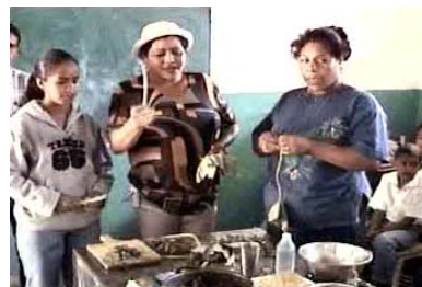
Grupo de mujeres explicando cómo hacen la Pira Verde, sopa de la Sierra de Falcón

Haciendo Historia Fortaleciendo Nuestra Identidad Construyendo Nación Historias Locales en Venezuela