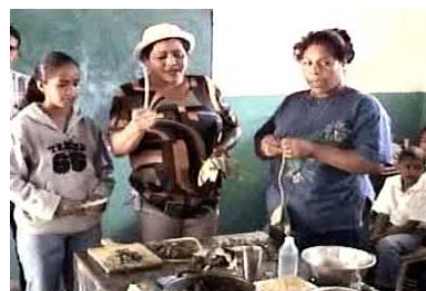
Grupo de mujeres explicando cómo hacen la Pira Verde, sopa de la Sierra de Falcón

Haciendo Historia Fortaleciendo Nuestra Identidad Construyendo Nación Historias Locales en Venezuela