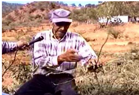
Campeño de Falcón explicando cómo hacer una cesta de bejuco.